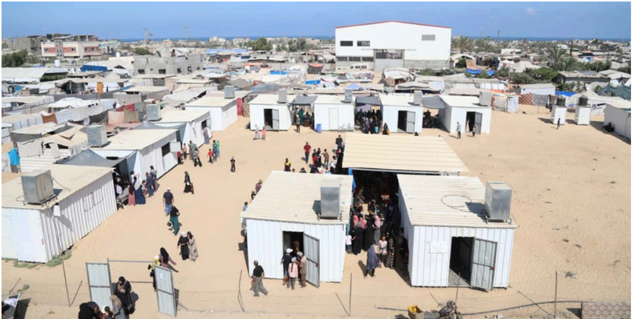
Tentes de personnes réfugiées à Al-Mawasi, Khan Younis, août 2024.