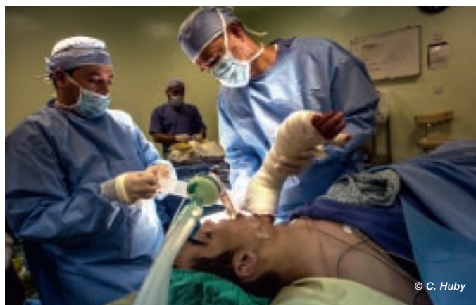
> Programme MSF de chirurgie à Amman.