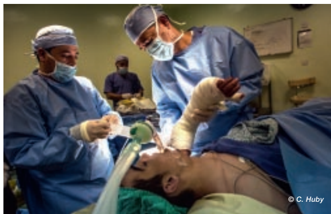
> Chirurgieproject van AZG in Amman.