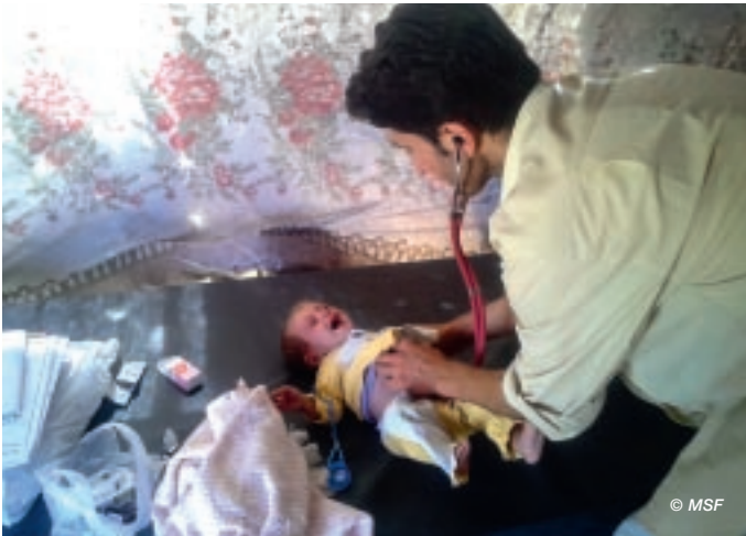
> Raadpleging in het ontheemdenkamp van Al Safira, ten noorden van Aleppo.