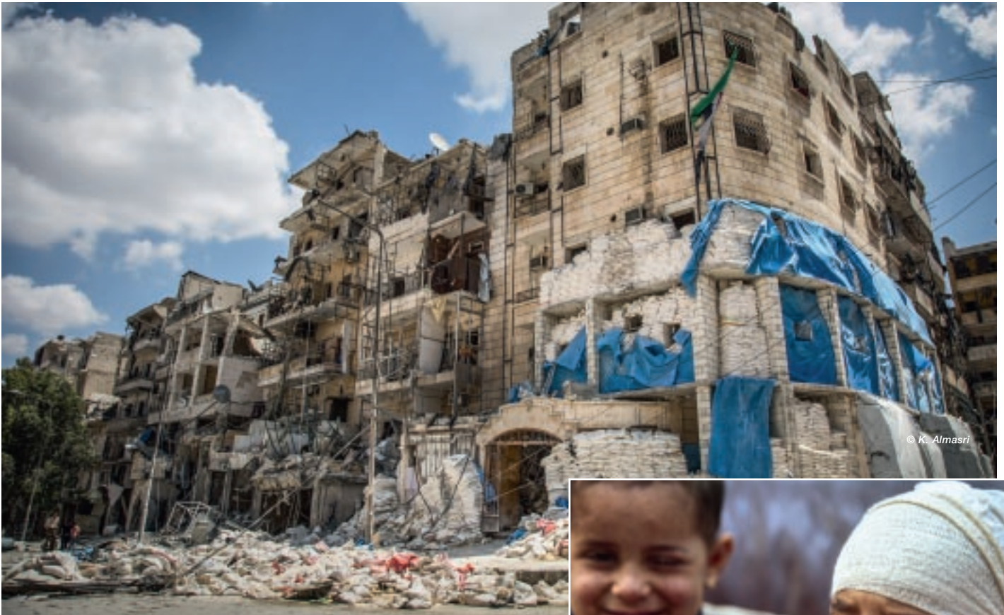
> Een van de vele verwoeste ziekenhuizen in Aleppo.